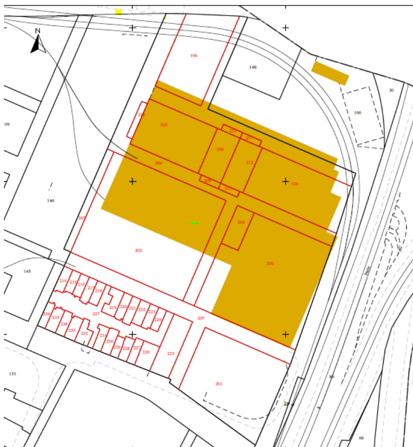
Figure 2 : source : extrait cadastral - Observation cardinal enquête publique

Conformément aux articles L. 515-9, R. 123-2 à R. 123-27, R. 515 -31-3 à R. 515 -31-6 du code de l'environnement, un projet d'AP modificatif a été soumis d'une part à enquête publique et, d'autre part, à avis des propriétaires identifiés, du conseil municipal de la ville de Bordeaux et du conseil départemental de l'environnement et des risques sanitaires et technologiques (CODERST).